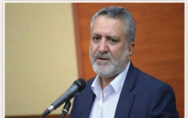
یادداشت مدیرمسئول آقای وزیر! پول ندارید!؟