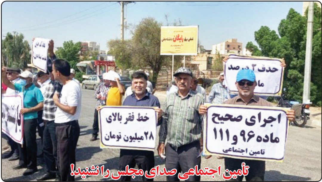
تأمین اجتماعی صدای مجلس را نشنید!