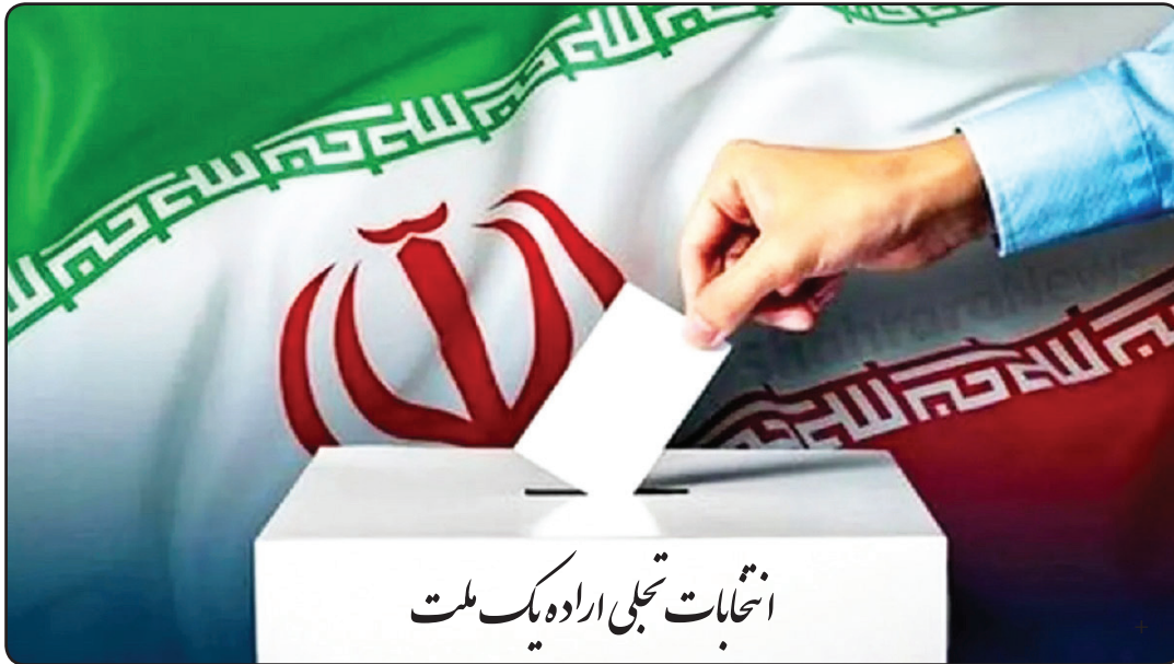
انتخابات تجلی اراده یک ملت

نباید سرمایه عظیم برآمده از مشارکت شرکای اجتماعی خود را ارزان بفروشند