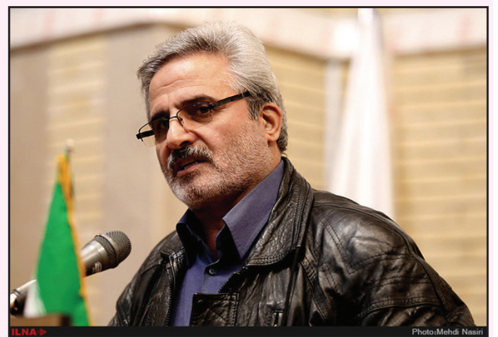
به قلم مدیر مسئول

شد و متولیان انتخابات کارنامه درخشانی از خود برجای گذاشتند؛ به همه عزیزان خداقوتی جانانه عرض می نمایم. به عنوان سخنگو و زبان اتحادیه پیشکسوتان جامعه کارگری در نشریه این اتحادیه خرسندی کامل خویش را از حسن انتخاب آقای دکتر پزشکیان اعلام نموده و یقین داریم ایشان به عنوان پزشکی عالقدر و سیاستمداری که دو دهه در سنگرمجلس ۴ سال در مسند وزارت بهداشت انجام وظیفه کرده اند؛ همانگونه که در مناظره ها صادقانه سخن گفتند و محبوبیت خاصی در میان افکار عمومی کسب نمودند؛ اینک به خوبی به شرایط کشورمان آگاه هستند و طبق وعده اشان با تیمی متخصص و جمعی از کارشناسان برای ۴ سال آینده در تمامی عرصه ها با برنامه و هدفمند حرکت خواهند کرد. البته برنامه هفتم توسعه بدون شک چراغ راه آینده این طیب گرامی خواهد بود.