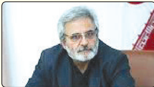
مطالبه کارگران است.

ما به طور جد، هشدار می‌دهیم که ادامه چنین روندی قابل تحمل نیست و در صورت تکرار و ادامه وضع موجود، ناچار به انتقال گزارش عملکرد آن‌ها به جامعه مخاطب خواهیم بود.