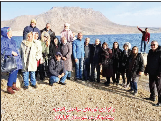
برگزاری تورهای سیاحتی اتحادیه پیشکسوتان در شهرستان کلبلیگان