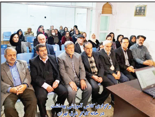
برگزاری کلاس آموزشی بهداشت در خانه کارگر شرق تهران