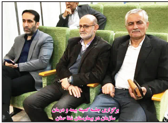
برگزاری جلسه کمیته بیمه و درمان سازمان در بیمارستان شفا سنجان