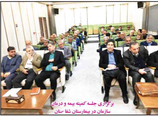
برگزاری جلسه کمیته بیمه و درمان سازمان در بیمارستان شفا سنجان