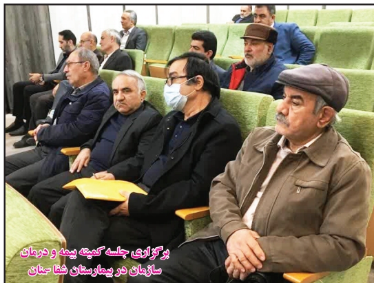
برگزاری جلسه کمیته بیمه و درمان سازمان در بیمارستان شفا سنجان