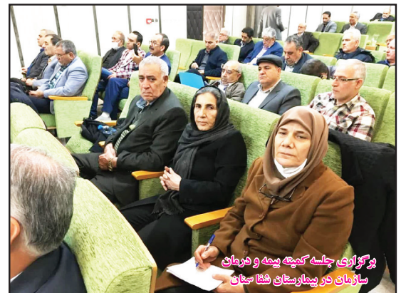
برگزاری جلسه کمیته بیمه و درمان سازمان در بیمارستان شفا سنجان