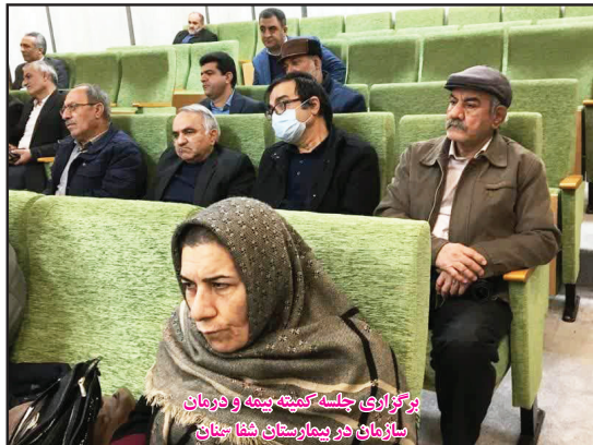
برگزاری جلسه کمیته بیمه و درمان سازمان در بیمارستان شفا سنجان