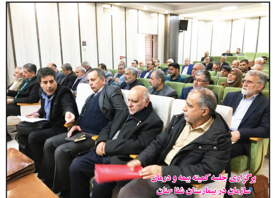
برگزاری جلسه کمیته بیمه و درمان سازمان در بیمارستان شفا سنجان